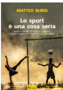
Lo sport è una cosa seria €16.00

ALLENATORI di Paolo Negri pp. 136 - euro 10,00 978-88-7495-668-5 [Dettagli...]