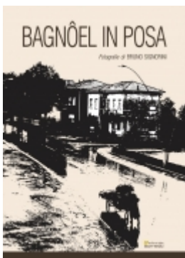
Bagn el in posa €10.00

Altro che Bronx! Racconti di un prete a Lunetta e dintorni di Alessandro Franzoni pp. 128 - euro 10,00 cm 15x21 - illustrato a colori 9788874956623 [Dettagli...]