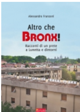
Altro che Bronx! €10.00

Tuffiamoci nella provincia profonda, un mondo assai fertile di storie grandi e piccole, scenari spesso incontaminati, iniziative popolari, personaggi straordinari, dove spesso basta una fotografia per restituirci il senso profondamente umano delle piccole comunit 